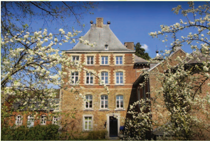
Château Cortils, Blegny, in de Belgische Voerstreek